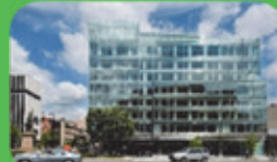
エネルギー効率化