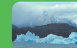
新技術への資金供与