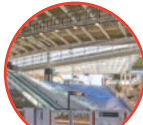
南町田グランベリーパーク