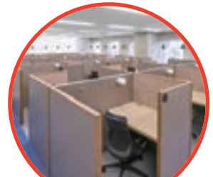
サテライトシェアオフィス (NewWork)