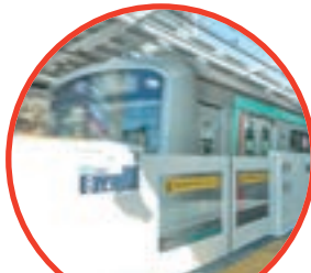
ホームドアの設置